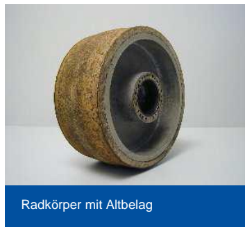
Radkörper mit Altbelag